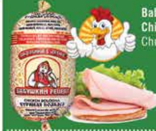
Babushka's Recipe Chicken Bologna Chub 16 oz