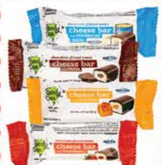
Family Tree Cheese Bars 36 g Selected Varieties