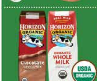
Horizon Organic Milk 8 oz Selected Varieties