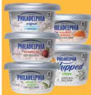
Philadelphia Cream Cheese 7.5 - 8 oz Selected Varieties