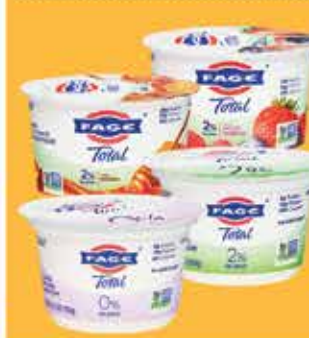
Fage Yogurt 5.3 oz Selected Varieties