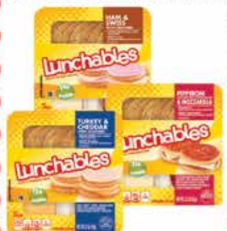
Lunchables Lunch Combinations 2.25 - 4.4 oz Selected Varieties