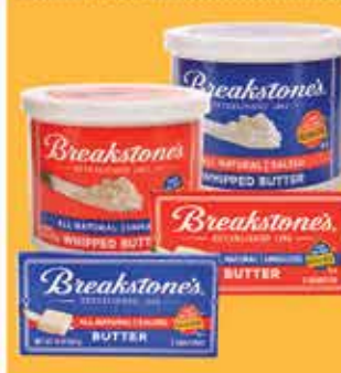
Breakstone's Butter 8 oz Selected Varieties