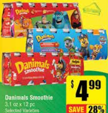
Animals Smoothie 3.1 oz x 12 pc Selected Varieties