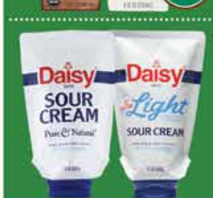
Daisy Squeeze Sour Cream 14 - 14.72 oz