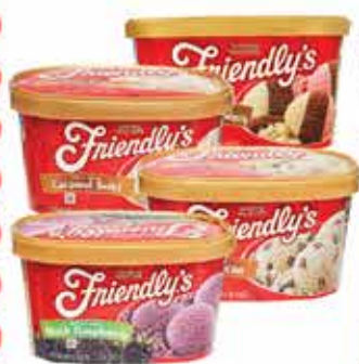
Friendly's Ice Cream 48 oz Selected Varieties