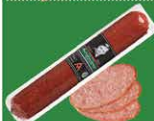
Alex's Meat Buterbrodnaya Kielbasa