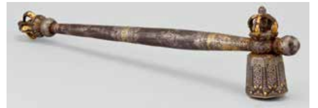
Железный ритуальный молоток с золотыми и серебряными вставками, Китай, династия Мин, 1403-1424 годы.

Бодхисаттвы и тантрические божества также изображались в виде мирных или гневных женщин.