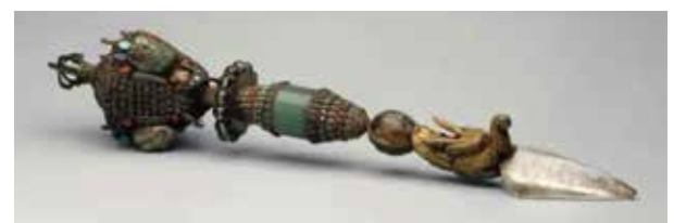
Пхурбу, около 1700 года, Центральный Тибет, бронза, хрусталь, нефрит, опал и бирюза с позолотой и полудрагоценными камнями.

Работы из Гималаев ранее были представлены на нескольких важных выставках, таких как «Через общие воды: современные художники в диалоге с тибетским искусством» из коллекции Джека Шира в Музее искусства колледжа Уильямса. Гималайское искусство открывает новые идеи и способы мышления, а видение объекта в новом контексте может вызвать абсолютно разные смыслы и вдохновить на учения. Выставка разделена на три сегмента — ландшафт, архитектура и тело, демонстрирующие, как различные артефакты могут предупредить нас о тех аспектах реальности, которые остаются незамеченными.